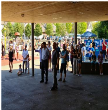
Gäste des Labelfestes