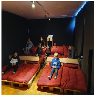
Kino im Jugendraum