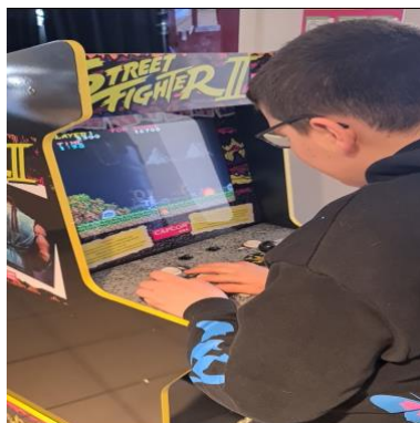
Es muss nicht immer die PS sein