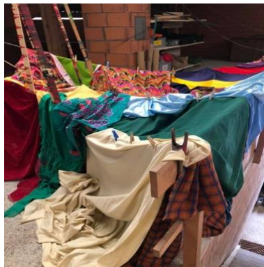
Impressionen Pop- up Spielplatz