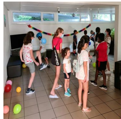
Musikspiel während der Disko