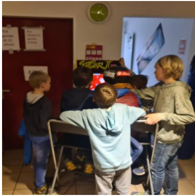
Am Automaten gamen