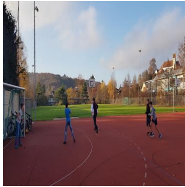
Fussball vor dem Jugendraum