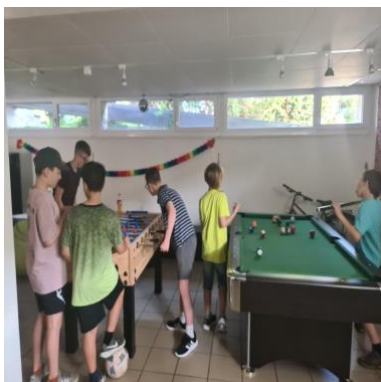
Billard und Töggelikasten