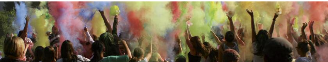
Holispektakel Jugendfest Rheinfelden