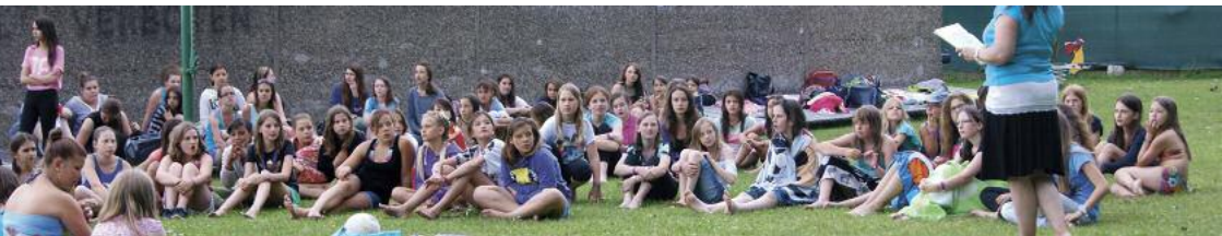
Girls pool night

Das riesige Engagement für den jungen Verein der damals noch zahlreichen Vorstandsmitglieder, die verschiedene Institutionen und Vereine zum Thema Kinder und Jugend vertraten, hat mich zutiefst beeindruckt.