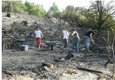
Der Brand zerstörte die Hüttenstadt auf dem Robispielplatz vollständig.