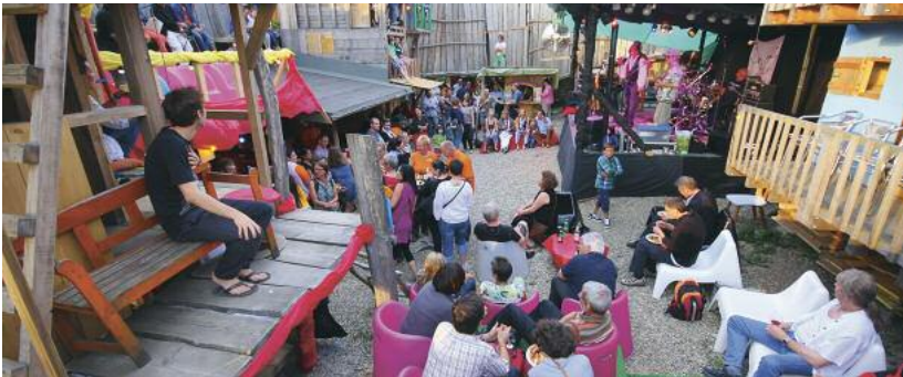
Mit einem Benefizanlass 2013 wurde der Wiederaufbau gefeiert.