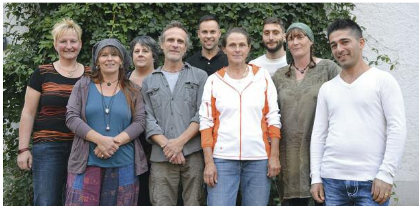
Die Mitarbeitenden des schjkk

Der Verein schjkk ist in der glücklichen Lage mit gut ausgebildeten und sehr erfahrenen Fachkräften zusammenarbeiten zu können. Teilweise sind die Mitarbeitenden dem schjkk und den Kindern und Jugendlichen seit Jahrzehnten treu geblieben. Von ihrer starken Identifikation mit ihrer Arbeit, sowohl im pädagogischen Bereich wie auch im aufwändigen Unterhalt der Betriebe profitieren alle Beteiligten. Diese Anforderung steht in keinem Pflichtenheft. Der Vorstand des Vereins schjkk versteht dieses Engagement seiner Mitarbeitenden als grosses Kompliment für ihn als Arbeitgeber.